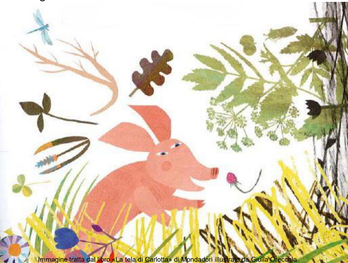
Immagine tratta dal libro «La tela di Carlotta» di Mondadori illustrato da Giulia Orecchia