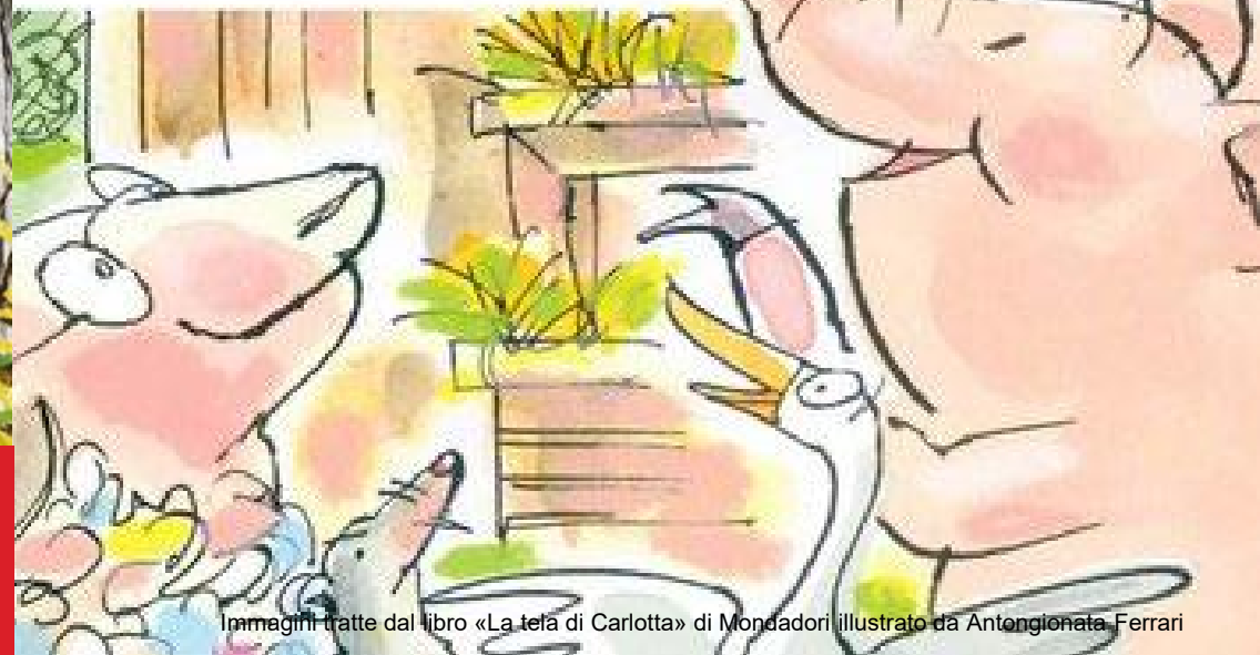
Immagine tratta dal libro «La tela di Carlotta» di Mondadori illustrato da Antonella Ferrari